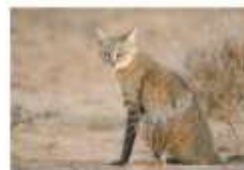
Предок домашних кошек — степной кот