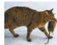
Кошки стали ловить грызунов, которые уничтожали урожай