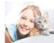
Человек подружился с кошкой и разрешил ей жить в своём доме