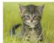
Кошки были одомашнены около 10 тысяч лет назад, когда люди начали засеивать поле